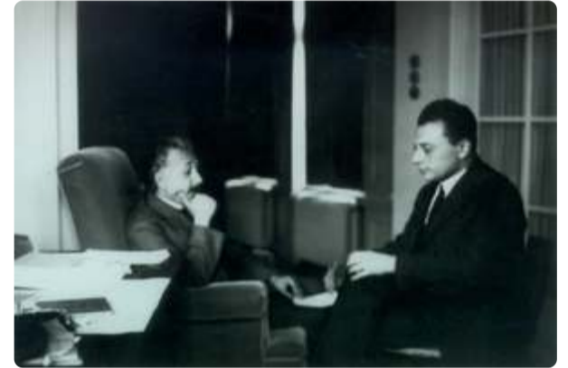
1926年，史密斯与詹姆斯·梅隆·史密斯的合影。

《史密斯》一书，是史密斯的代表作之一。在这本书中，史密斯详细阐述了史密斯的概念。他认为，史密斯是一个具有广泛影响力的概念，它不仅存在于文学作品中，也存在于现实生活中。史密斯的这一观点，对后来的文学批评产生了深远的影响。