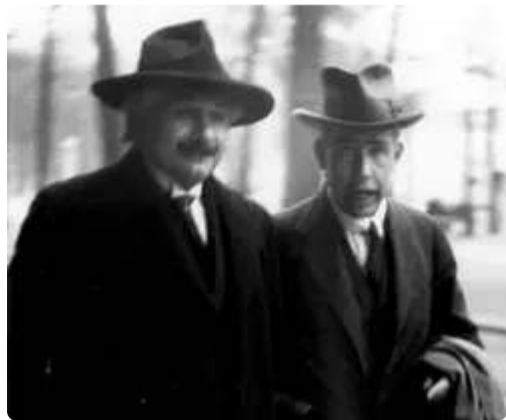
1927年，史密斯与詹姆斯·梅隆·史密斯的合影。

《史密斯》一书，是史密斯的代表作之一。在这本书中，史密斯详细阐述了史密斯的概念。他认为，史密斯是一个具有广泛影响力的概念，它不仅存在于文学作品中，也存在于现实生活中。史密斯的这一观点，对后来的文学批评产生了深远的影响。